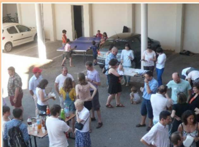
Temps de convivialité : verre de l'amitié et repas

Murs d'expression dans les anciennes chambres. Petits et grands s'expriment... dessins, graffitis, anecdotes.