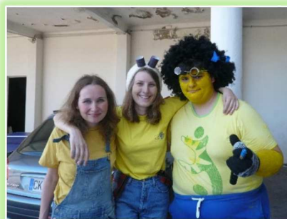
Grand Jeu animé par les minions (petites créatures jaunes, de film d'animation)