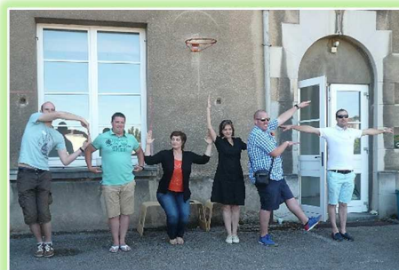
Faire découvrir le nom de son équipe en formant des lettres avec le corps